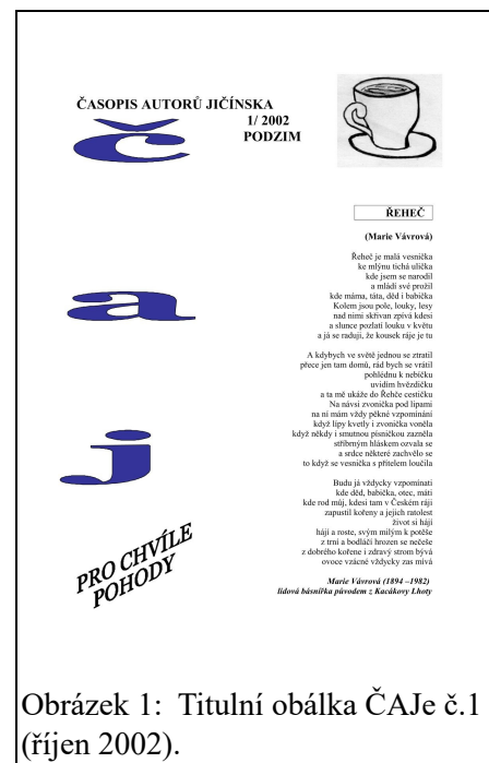
Obrázek 1: Titulní obálka ČAJe č.1 (říjen 2002).

Od ledna 2005 začal vycházet ČAJ s titulní obálkou, kterou vytvořil Pavel Hons (=Jozef dŘevník Borovský, viz obrázek 2).